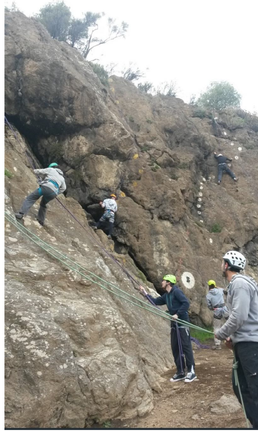
Ilustración 3 - Prácticas de Escalada en Virgen de las Nieves conducidas por alumnos de 4to año