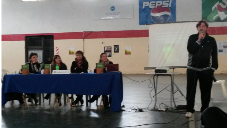
Ilustración 1 - Presentación libro "Tiempo de Jugar, Tiempo de Aprender"